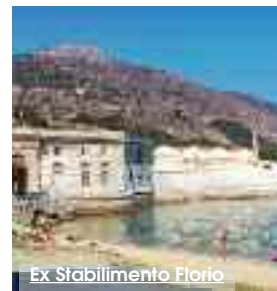
Ex Stabilimento Florio

Da oggi l'ex Stabilimento Florio di Favignana garantirà l'ingresso ai visitatori tutti i giorni, per la consueta apertura stagionale. Anche per maggio, l'ex Stabilimento Florio sarà aperto dalle 10 alle 14. Tre, invece, gli orari stabiliti per effettuare le visite guidate multilingue per conoscere il passato legato alla popolazione locale e alla tonnara: alle ore 10,30, alle ore 11 e alle ore 12. A giugno, invece, l'apertura al pubblico sarà garantita dalle ore 10 alle ore 17. A luglio, agosto e settembre dalle ore 10 alle ore 13,30 e dalle ore 17 alle ore 23, e ad ottobre l'orario di fruizione tornerà ad essere dalle 10 alle