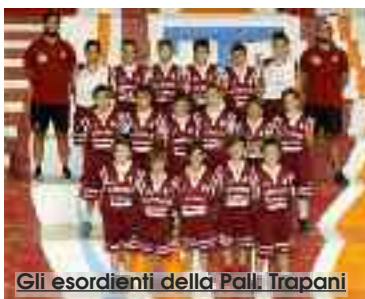
Gli esordienti della Pall. Trapani

Il settore giovanile della Pallacanestro Trapani sarà nuovamente in viaggio. Dopo le esperienze degli Under 13 e degli Under 16, questa volta a partire saranno gli Esordienti che da ieri pomeriggio sono impegnati nel "4 Memorial Renato Palumbi" di Bologna che si svolge in questo fine settimana.